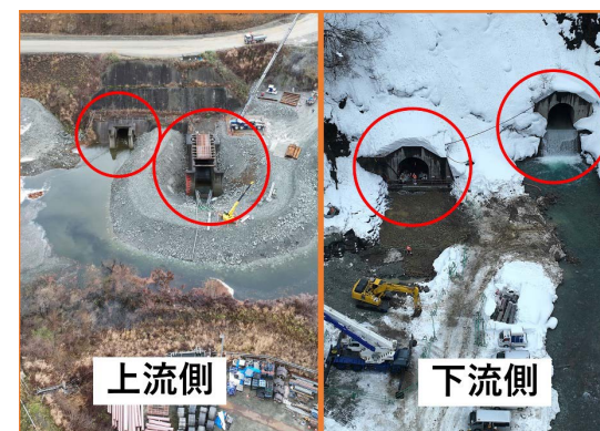
2本の転流トンネル(上流側・下流側)

工事中は川の水をこのトンネルに切り替えて流しています。ダム完成後の湛水時にはこのトンネルをふさぐため、流量の少ない冬期にその準備工を進めています。