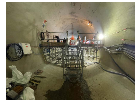
転流トンネル内のようす 幅5m・高さ5m・全長950mのトンネルの中では、6人程度の作業員が昼夜交代体制でグラウチング作業を行っています。

工事中は川の水をこのトンネルに切り替えて流しています。ダム完成後の湛水時にはこのトンネルをふさぐため、流量の少ない冬期にその準備工を進めています。